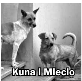
Kuna i Miecio