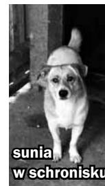
sunia w schronisku