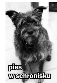
pies w schronisku