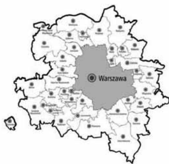
Obszar Zintegrowanych Inwestycji Terytorialnych

Aglomeracja warszawska aspiruje do bycia silnym ośrodkiem społeczno-gospodarczym w Europie z zachowaniem perspektywy lokalnej. Istotnymi narzędziami niezbędnymi do realizowania tego celu są działania na rzecz zintegrowania m.st. Warszawy z otoczeniem, a więc z gminami silnie powiązаныmi z nim funkcjonalnie. Współpracę wynikającą z potrzeby rozwiązywania problemów miasta i jego otoczenia w szerszej skali przyspieszyła zapowiedź wdrożenia mechanizmu Zintegrowanych Inwestycji Terytorialnych w ramach nowej perspektywy finansowej UE 2014-2020. Instrument ten stał się katalizatorem integracji m.st. Warszawy z otaczającymi je gminami, które zadeklarowały chęć wspólnej realizacji działań. Głównym źródłem finansowania przedsięwzięć inwestycyjnych realizowanych w zakresie podpisanego porozu-