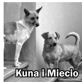
Kuna i Miecio