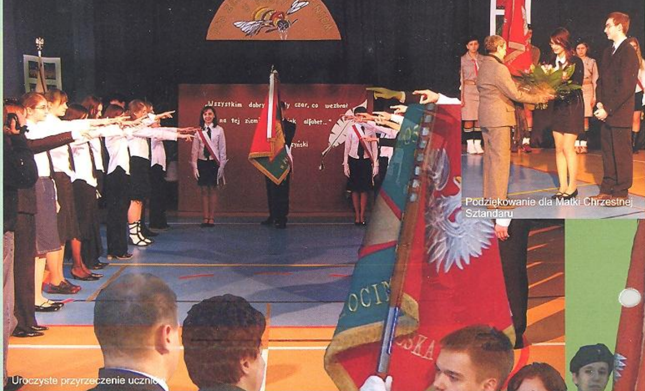
Podziękowanie dla Matki Chrzestnej Sztabu

Gimnazjum w Płochocinie przyjęło imię K. I. Gałczyńskiego 29 stycznia 2005r.