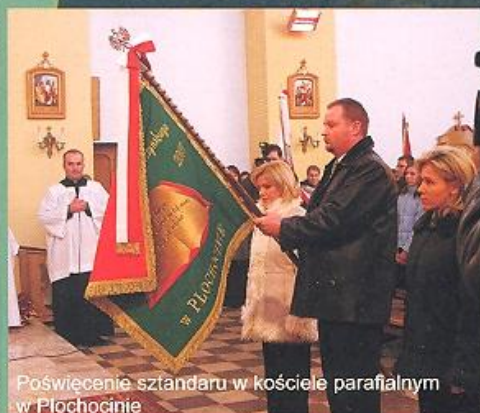
Poświęcenie sztandaru w kościele parafialnym w Płochocinie