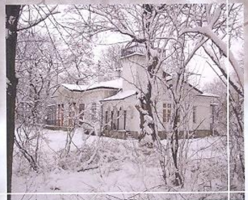
Dworek w Golaszewie