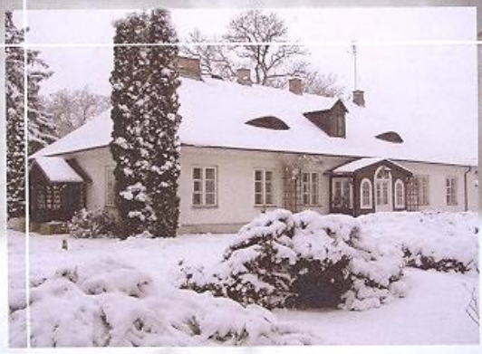
Dworek w Ozarówie Maz.