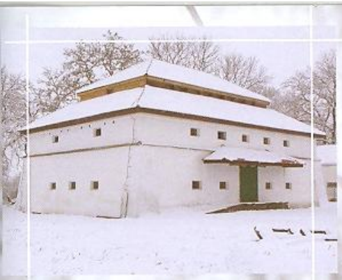
Spichlerz w Golaszewie