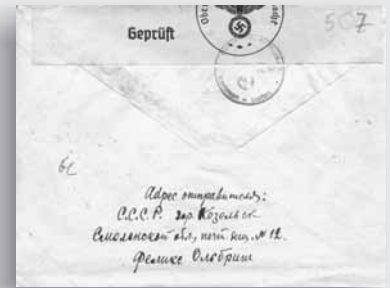
List z Kozielska - pamiątka córki po zamordowanym ojcu

Po wojnie około 400 m od dołów śmierci powstawały pokryte trawą prostokąty i czerwony murek z dwujęzycznym napisem wrytym na czarnym granicie: „Pamięci polskich oficerów zabitych przez hitlerowców w 1941 roku.”. Dopiero w kwietniu 1989 r. rusza