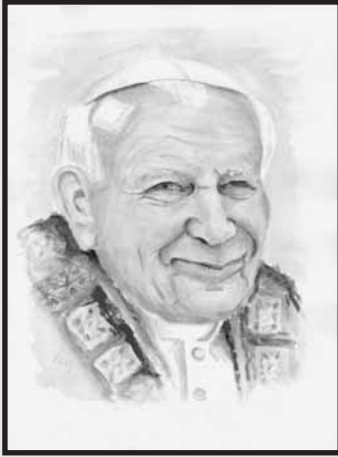
Jeden z portretów, które mogliśmy podziwiać na wystawie „Ojciec Św. - Moja Pasja” w D.K. „Uśmiech” w Ożarowie Maz.

Dotykając rękami historii nie zawsze mamy świadomość wpływu, jaki wywiera na nas, jakie kształtuje zachowania i co odciska w sercu.