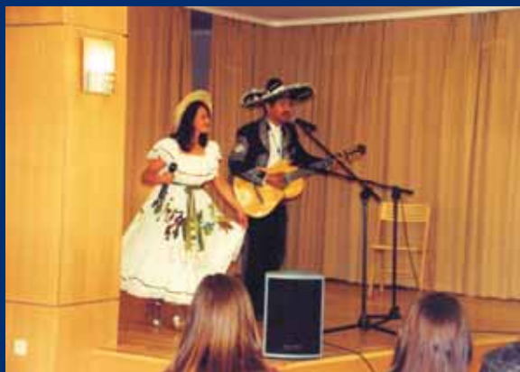
Występ duetu latynoamerykańskiego z trakcie spotkania z podróżnikiem