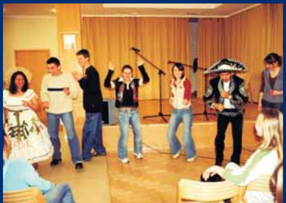
Nauka salsa na zakończenie spotkania z podróżnikiem