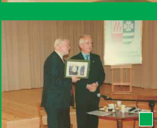
Spotkanie z Gościem Burmistrza - profesorem Jerzym Hausnerem