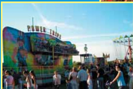
Dodatkową atrakcją było „Wesołe miasteczko”