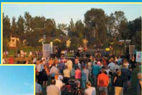
Koncert zespołu „Sedan” z Płochocina

Impreza zakończyła się późnym wieczorem tańcami przy muzyce zespołu „Fortepian” z DK „Uśmiech”