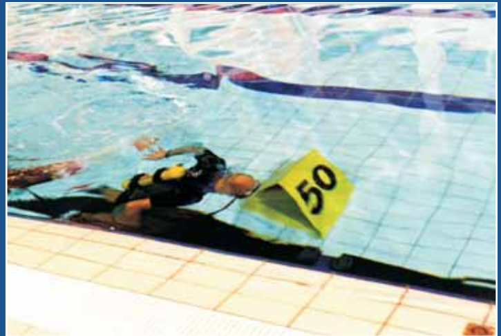
Zawodnik na półmetku trasy.