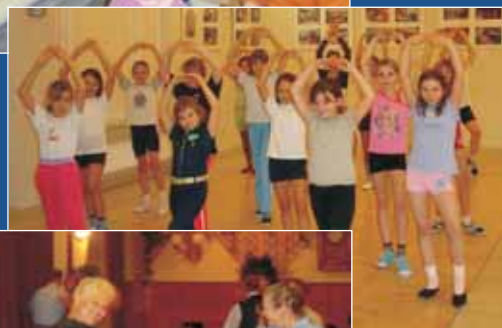
Grupa tańca nowoczesnego