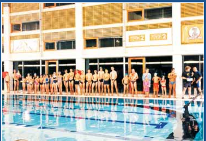
Na zakończenie programu skok do wody zgromadzonych na basenie