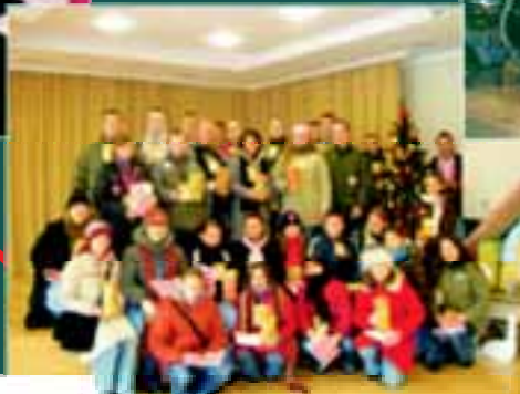
Wolontariusze Sztabu DK USMIECH