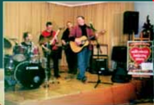
koncert zespołu STREFA