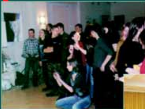
publi czność na koncercie zespołu HELIOS