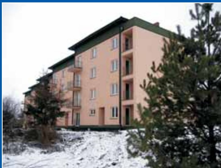
Uroczystość poświęcenia i wręczenia kluczy lokatorom 28 lutego 2006