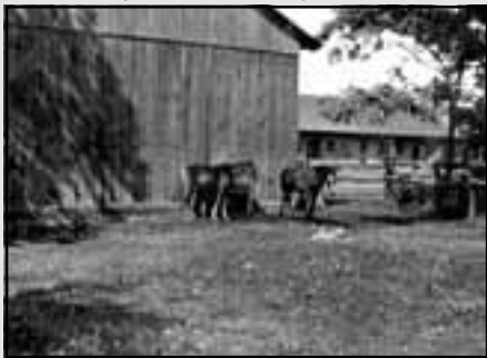
Zabudowania gospodarcze w Szeligach II.