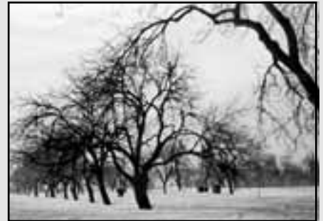
Sad w Szeligach II w okresie okupacji.