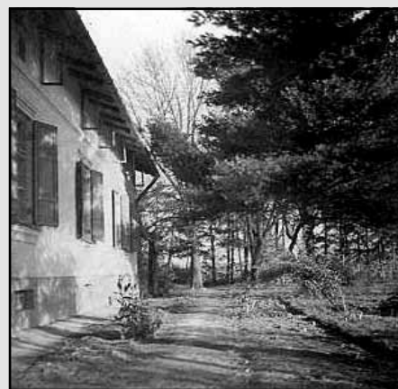
Dworek i otaczający go park w Szeligach II