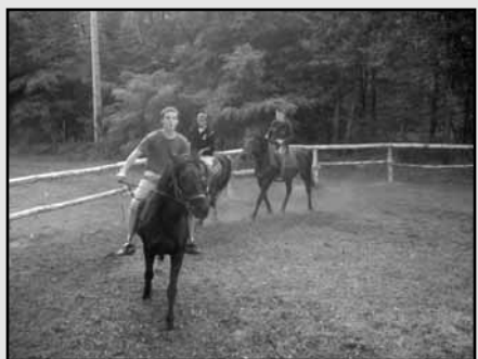
Jazda konna - hipoterapia

Opiekę nad wychowankami sprawują: pedagog szkolny, pedagodzy specjaliści,