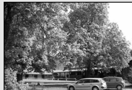
Drewniany budynek internatu chłopców oraz stajnia