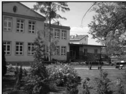
Szkoła – budynek główny

Od września 2007 roku planujemy otworzyć przedszkole. Jego otwarcie jest uzależnione jednak od ilości chętnych, dlatego też wszystkich zainteresowanych prosimy o kontakt osobisty bądź telefoniczny z Ośrodkiem lub Powiatem Warszawskim-Zachodnim (Wydział Oświaty tel. 022 733-72-41).