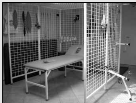
Sala do rehabilitacji

Warunkiem ubiegania się o przyjęcie do szkoły jest złożenie podania do Starosty Powiatu na terenie którego uczeń jest zameldowany. Starosta ten zwraca się z kolei do Starosty Powiatu Warszawskiego Zachodniego, któremu podlega Zasadnicza Szkoła Zawodowa przy SOSW w Lesznie.