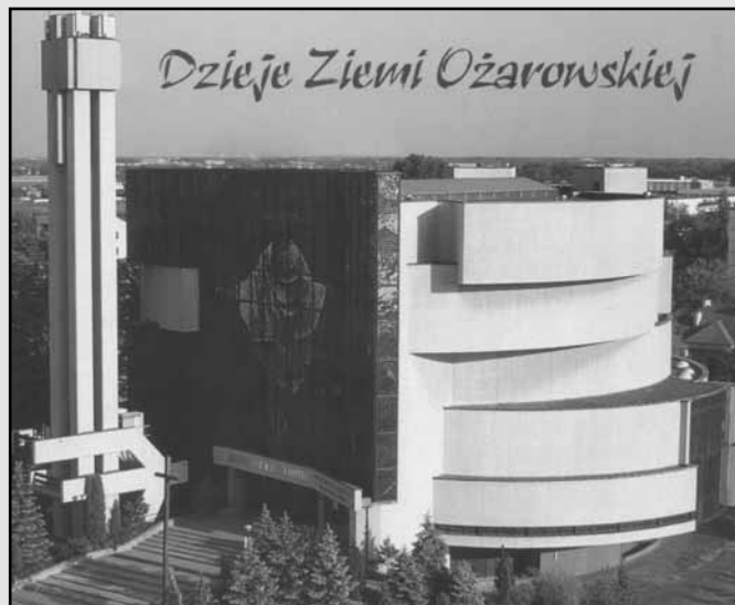
Album do nabycia w kasie Urzędu Miasta i Gminy