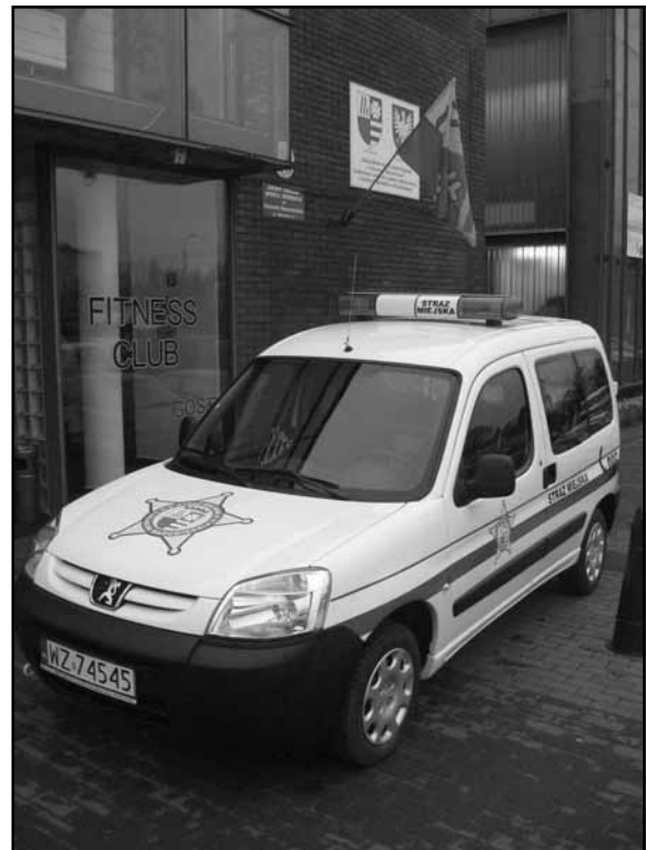
Peugeot Partner - nowy radiowóz Straży Miejskiej w Ożarowie Mazowieckim.

7.11 – Płochocin, ul. Dworcowa 18 – palące się dwa samochody osobowe marki Mercedes – podjęte działania to jeden prąd z