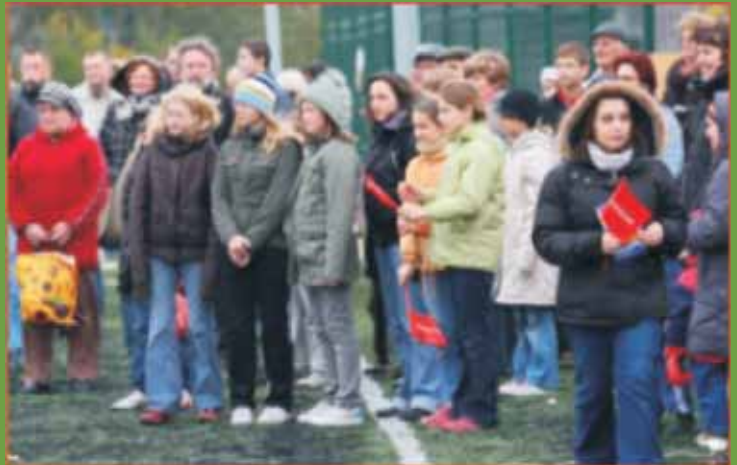
fol. R. Kosłowski