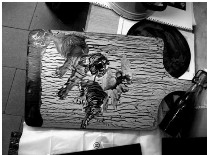
Decoupage na deskach do krojenia ... ... i starym zegarze