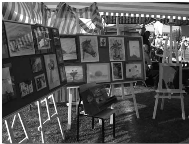
Stoisko koła plastycznego Gimnazjum w Płochocinie