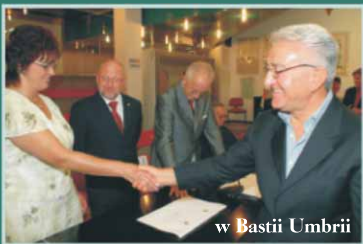
w Bastii Umbrii