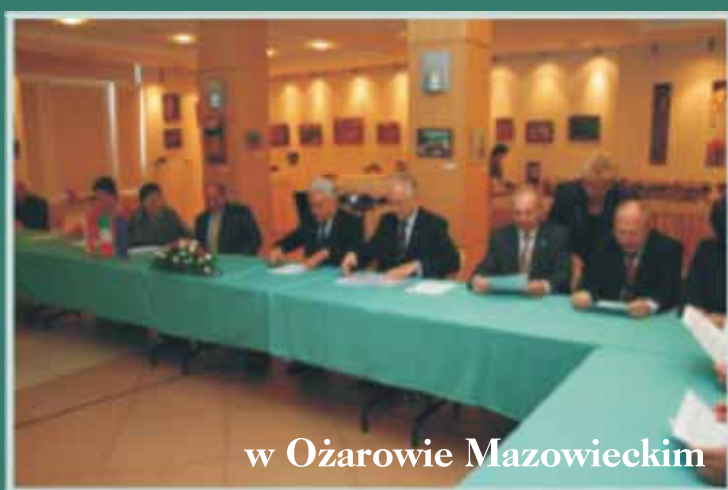
w Ożarowie Mazowieckim