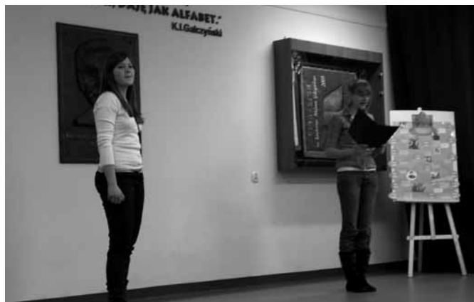
Uczennice Gimnazjum im. Ks. Aleksandra Fedorowicza w Izabelinie w scenie Teatrzyku „Zielona Gęś”

sięgnęli po laur zwycięstwa w tym roku, z pewnością spróbują w następnej edycji.