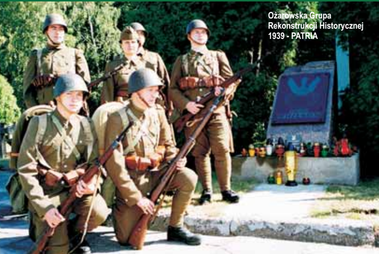
Ożarowska Grupa Rekonstrukcji Historycznej 1939 - PATRIA