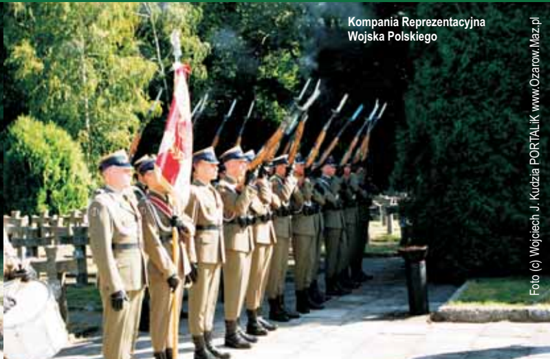
Kompania Reprezentacyjna Wojska Polskiego