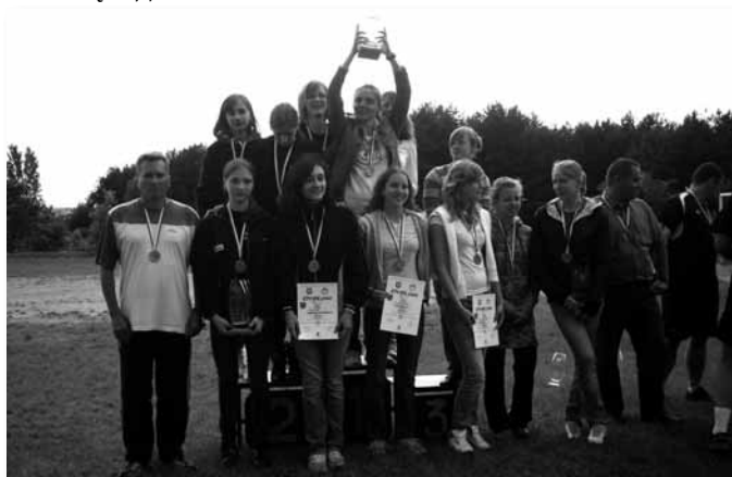
Srebrny medal - dwubój dziewcząt.

W finałach XI Mazowieckich Igrzysk Młodzieży Szkolnej w Siedlcach rywalizowali uczniowie naszego Gimnazjum w dwuboju dziewcząt, pływaniu dziewcząt, pływaniu chłopców i lekkoatletyce. W finałach startowało 12 najlepszych szkół z Mazowsza, które wygrały eliminacje gminne, powiatowe i międzypowiatowe.