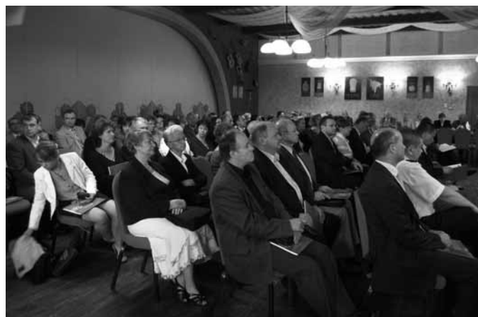
W konferencji uczestniczyło około 130 osób

byli Powiatowy Urząd Pracy, Starostwo Powiatu Warszawskiego Zachodniego oraz Gminy Ożarów Mazowiecki i Błonie. W spotkaniu udział wzięli: samorządowcy, lokalni pracodawcy, przedstawiciele wielu instytucji związanych z lokalnym biznesem i mieszkańcy gmin. Głównym tematem konferencji była analiza składników środowiska gospodarczego gmin biorących udział w partnerstwie.