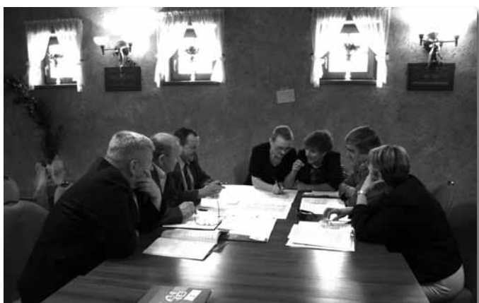
Jednym z etapów konferencji była praca w grupach.

Warto w niej uczestniczyć i mieć wpływ na lokalną rzeczywistość.