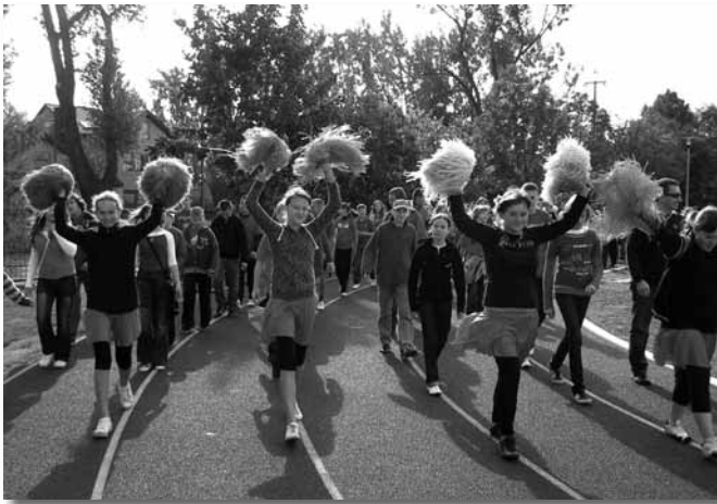
Parada - uczniowie gimnazjum.

W dniu 30 września Gimnazjum i Szkoła Podstawowa w Płochocinie świętowały otwarcie nowych obiektów sportowych. Rozpoczęto uroczystą paradą, w której wzięli udział uczniowie obu szkół wraz z nauczycielami. Przypominała ona uroczystość otwarcia igrzysk olimpijskich i była okazją do zaprezentowania się barwnie ubranych klas. Każda z nich zaprezentowała się w innym kolorze i z innymi przyborami sportowymi. Następnie na maszty zostały wciągnięte flagi: narodowa, gminna i Unii Europejskiej.