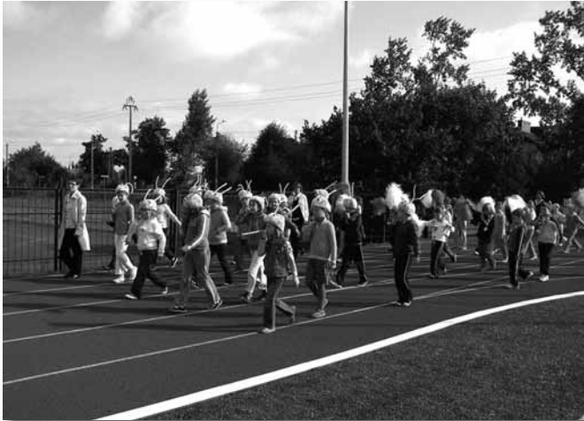
Parada - uczniowie szkoły podstawowej z klas 1-3.

W dniu 30 września Gimnazjum i Szkoła Podstawowa w Płochocinie świętowały otwarcie nowych obiektów sportowych. Rozpoczęto uroczystą paradą, w której wzięli udział uczniowie obu szkół wraz z nauczycielami. Przypominała ona uroczystość otwarcia igrzysk olimpijskich i była okazją do zaprezentowania się barwnie ubranych klas. Każda z nich zaprezentowała się w innym kolorze i z innymi przyborami sportowymi. Następnie na maszty zostały wciągnięte flagi: narodowa, gminna i Unii Europejskiej.