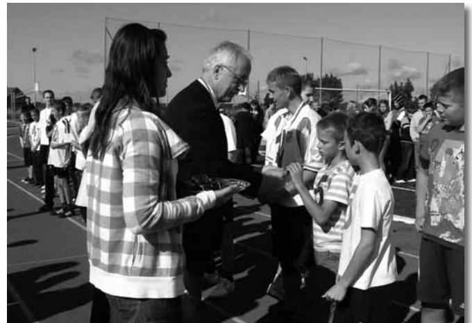
Wręczenie medali uczestnikom sztafety.

ników sztafety zostały rozegrane mecze piłki nożnej i koszykówki. Zawodnikiem, który zaskoczył wszystkich było słońce – wygrało z chmurami i deszczem.