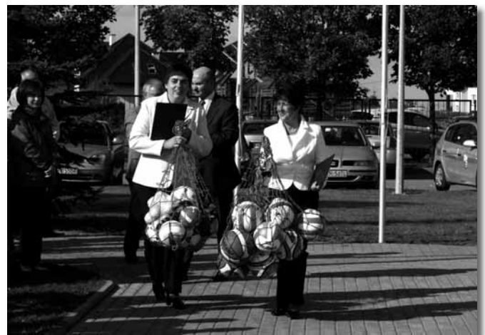
Ofiarowanie prezentów Gimnazjum i Szkole Podstawowej.