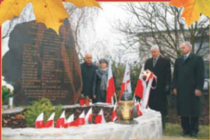
Pomnik Pamięci Mieszkańców pomordowanych w Topolinie 8 listopada