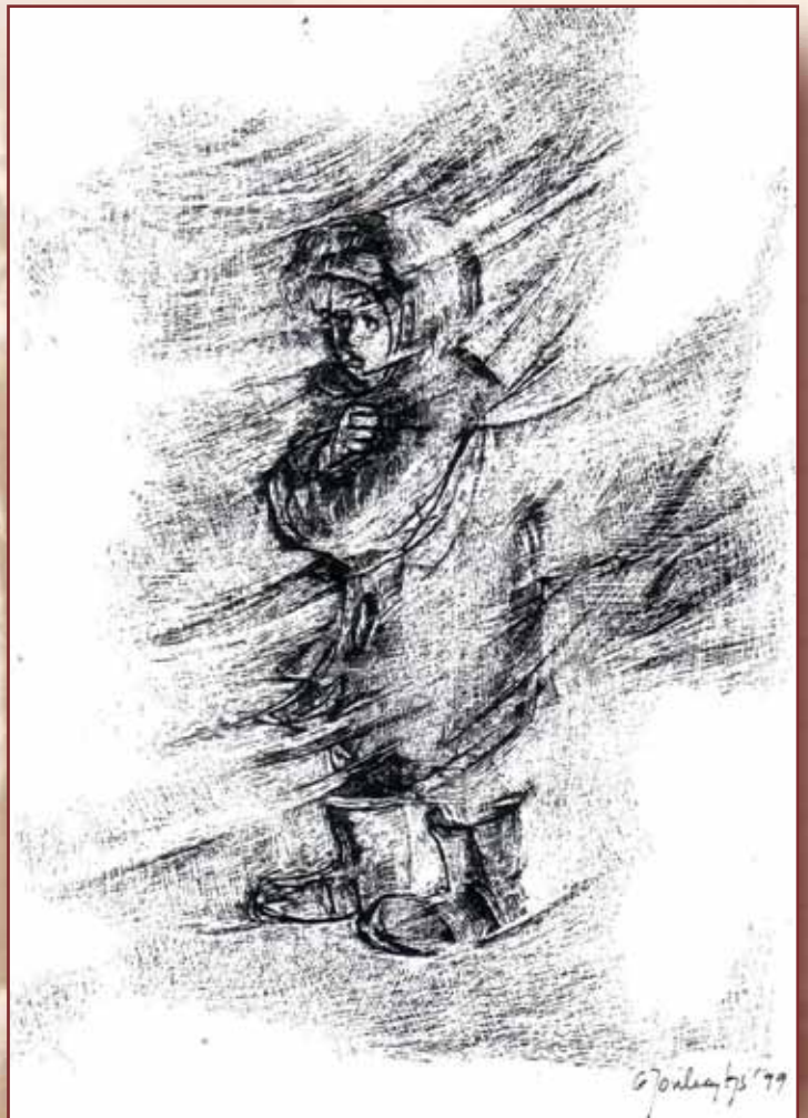
Rysunek Mariana Jonkajtys przedstawiający chłopca zesłanego w 1940 roku na Sybir

Rok 1940 był najbardziej tragicznym rokiem czasu wojny dla mieszkańców 8 kresowych województw Rzeczypospolitej Polskiej. Były to: województwo stanisławowskie, tarnopolskie, lwowskie ze Lwowem, wołyńskie ze stolicą województwa w Łucku, poleskie z Brześciem nad Bugiem, nowogródzkie, wileńskie z Wilnem i białostockie. Tereny te, obejmujące 202 000 km 2 , a więc przeszło połowę obszaru Rzeczypospolitej, zamieszkiwało 13 milionów obywateli polskich, wśród których znaczny procent stanowili Ukraińcy, Białorusini i Żydzi.