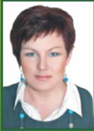
Blanka Jabłońska Przewodnicząca Rady Miejskiej