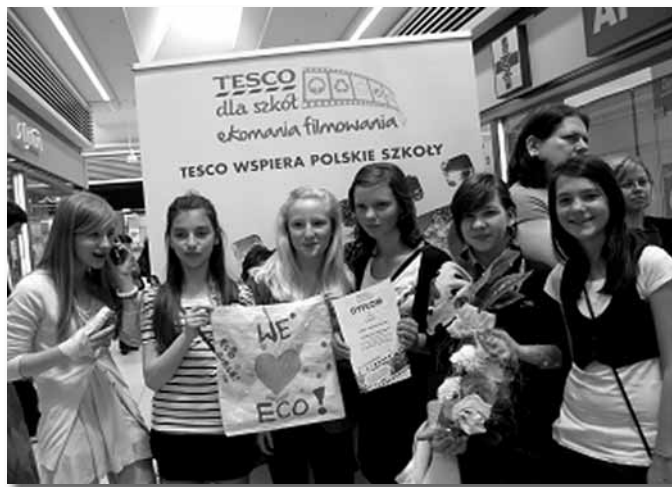
Zespół Eko Girls podczas Gali Finałowej

1 kwietnia odbyła się Gala Finałowa konkursu, podczas której zostały wręczone nagrody indywidualne - przenośne odtwarzacze DVD.