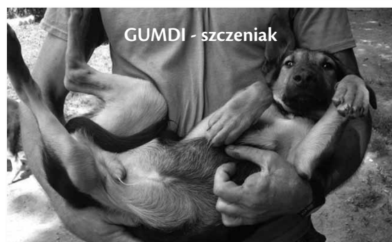
GUMDI - szczeniak