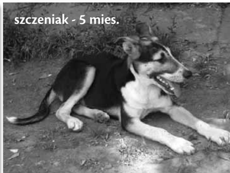
szczeniak - 5 mies.