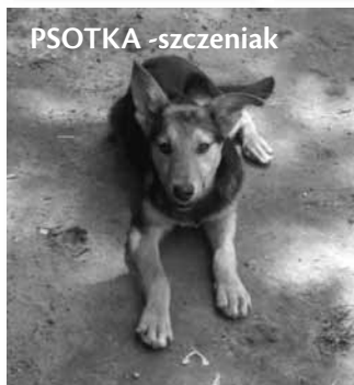
PSOTKA - szczeniak

Zwierzęta znajdujące się na zdjęciach czekają na nowe domy. Są zdrowe, zaszczepione i zachipowane.