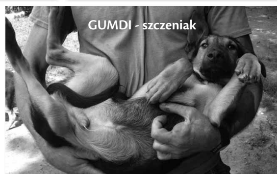
GUMDI - szczeniak