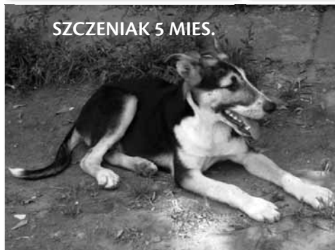
SZCZENIAK 5 MIES.