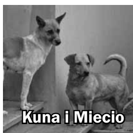
Kuna i Miecio