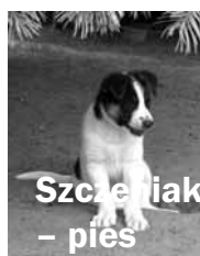
Szczeniak – pies