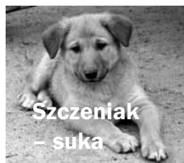
Szczeniak – suka