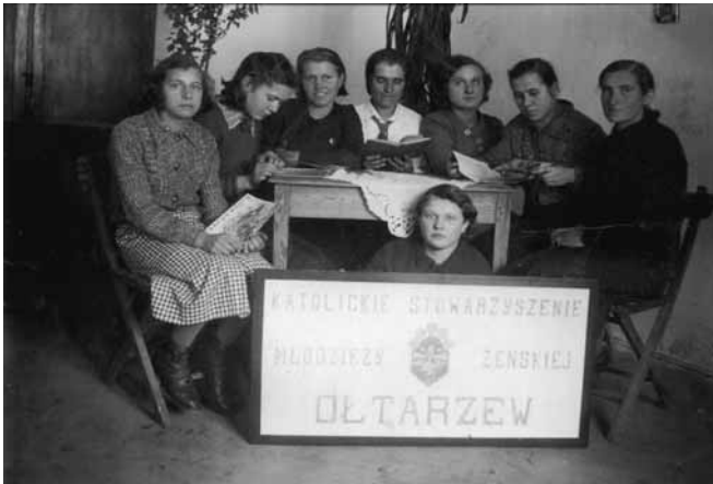
Katolickie Stowarzyszenie Młodzieży Żeńskiej