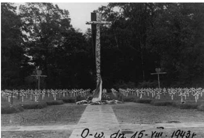
Cmentarz Wojenny w roku 1943

Pisząc artykuł skorzystałem z materiałów archiwalnych Towarzystwa Miłośników Ołtarzewa