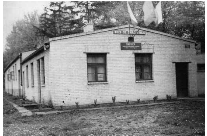
Świetlica TMO w latach 60.

się to wszystko zaraz po wojnie, był to proces kilkunastoletni, zakończony postawieniem sali widowiskowej. Sala była pozyskanym barakiem, który został obudowany cegłą. Ta prowizorka miała służyć tylko dziesięć lat a była użytkowana ponad czterdzieści. Inny ważny temat jaki spędzał sen z powiek to jakość dróg, gdyż wymagały one permanentnej naprawy, a koszty przekraczały możliwości finansowe Towarzystwa. Długie i żmudne rozmowy prowadzone z władzami Gminy Ożarów doprowadziły do przekazania nieodpłatnie wszystkich ulic, których właścicielem było Towarzystwo. Pewien zastój w działalności w dekadzie lat siedemdziesiątych szybko został zażegnany dzięki napływowi nowych i zarazem młodych członków. Do dnia dzisiejszego niektóre z tych osób czynnie uczestniczą w życiu osiedla i Gminy Ożarów Mazowiecki. W tym miejscu cofnę się jeszcze trochę w czasie i wspomnę o bardzo cennej inicjatywie TMO polegającej na przekazaniu terenów pod budowę Szkoły Podstawowej, jednej z pierwszych tzw. „Tysiąclatek”. Szkoła cieszy się dobrą renomą, chętnie posyłane są do niej dzie-