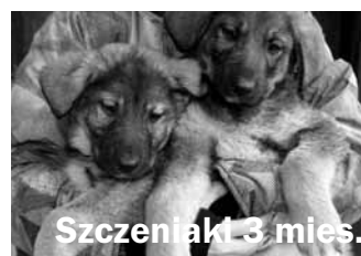
Szczeniaki 3 mies.

REDAKCJA NIE ODPOWIADA ZA TREŚĆ REKLAM I OGŁOSZEŃ, ZASTRZEGA SOBIE PRAWO SKRÓTÓW W NADESŁANYCH LISTACH I TEKSTACH niezamówionych materiałów i zdjęć nie zwracamy