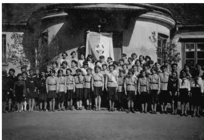
Dwór w Parku Ołtarzewskim