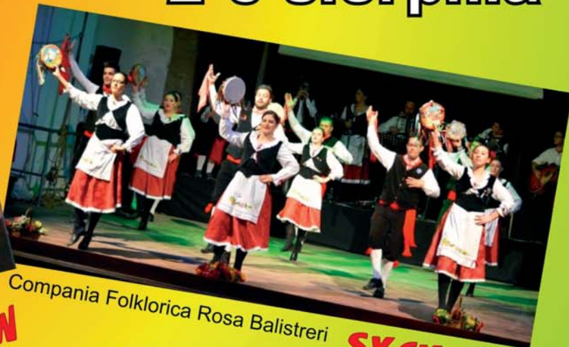
Compania Folklorica Rosa Balistreri