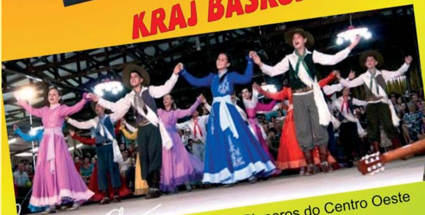
CTG Pioneros do Centro Oeste