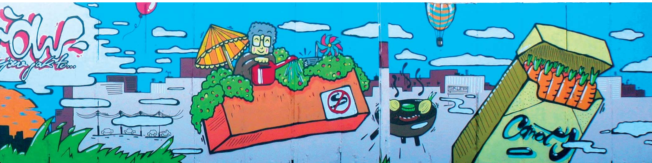
Mural na murze kotłowni na terenie Spółdzielni Mieszkaniowej „Ozarów”