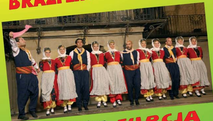
Bogazici Folk Dance Group