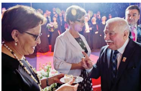
Pierwszy kawałek tortu z rąk prezydenta Lecha Wałęsy otrzymała Premier Ewa Kopacz, a następnymi Prezydent karmił chórzystki.