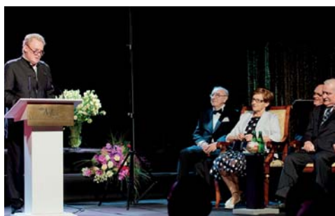
Laudacja i wiersz C. K. Norwida w wykonaniu Daniela Olbrychskiego.