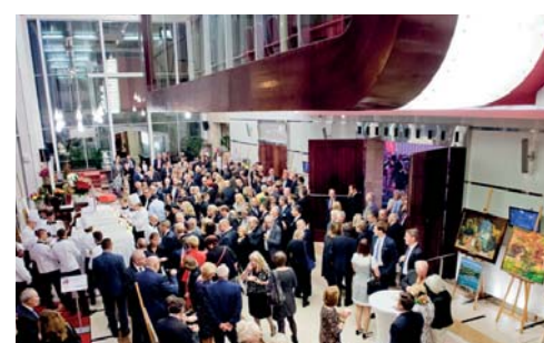
Wernisaż malarstwa i karykatury w hallu MCC Mazurkas.