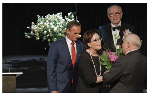
Prezydent Lech Wałęsa przyjmuje życzenia od Premier Ewy Kopacz i Mieczysława Wachowskiego na scenie sali Zeus.