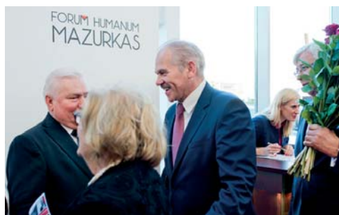
Jan Żychliński Starosta Powiatu Warszawskiego Zachodniego.

Forum Humanum Mazurkas jest inicjatywą obywatelską w dziedzinie kultury, której inauguracja miała miejsce w 2012 roku. Od tego czasu w centrum konferencyjnym hotelu MCC Mazurkas Conference Centre & Hotel kilka razy w roku odbywają się spotkania prezentujące muzycznych wirtuozów, orkiestry symfoniczne, małe zespoły oraz uznanych malarzy i rzeźbiarzy. Projekt realizowany jest w całości „pro publico bono”.