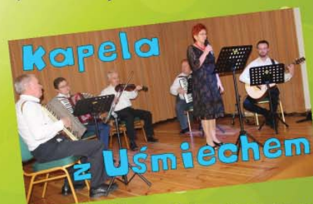
Kapela z Uśmiechem zespół z Domu Kultury "Uśmiech"