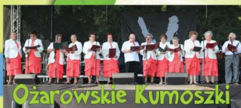
Ożarówskie Kumoszki zespół seniorów z Domu Kultury "Uśmiech"