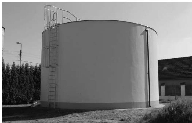
Rys. 2. Nowy zestaw hydroforowy