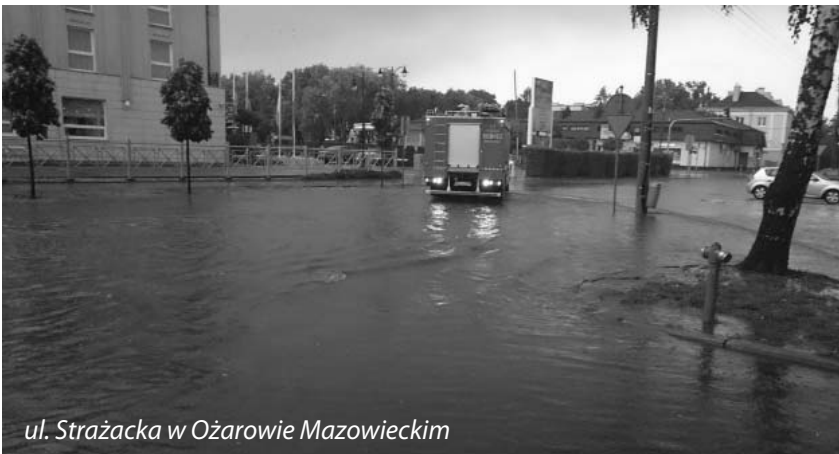
ul. Strażacka w Ożarowie Mazowieckim

Ochotnicza Straż Pożarna w Ożarowie Mazowieckim w pierwszej połowie 2016 roku wyjeżdżała alarmowo prawie 200 razy.