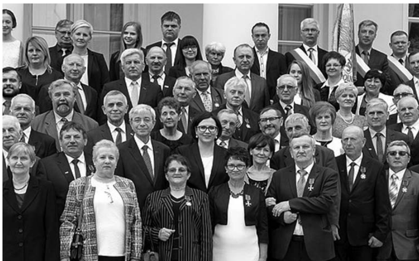
Uroczystości wręczenia odznaczeń państwowych w Belwederze.