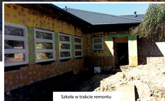
Szkoła w trakcie remontu